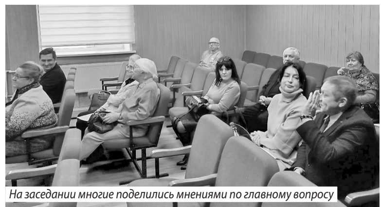
На заседании многие поделились мнениями по главному вопросу