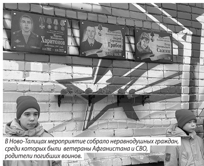
В Ново-Талицах мероприятие собрало неравнодушных граждан, среди которых были ветераны Афганистана и СВО, родители погибших воинов.

На книжной выставке читателям были представлены материалы о событиях афганской войны, воспоминания ветеранов-афган-