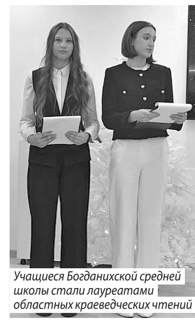
Учащиеся Богданинской средней школы стали лауреатами областных краеведческих чтений