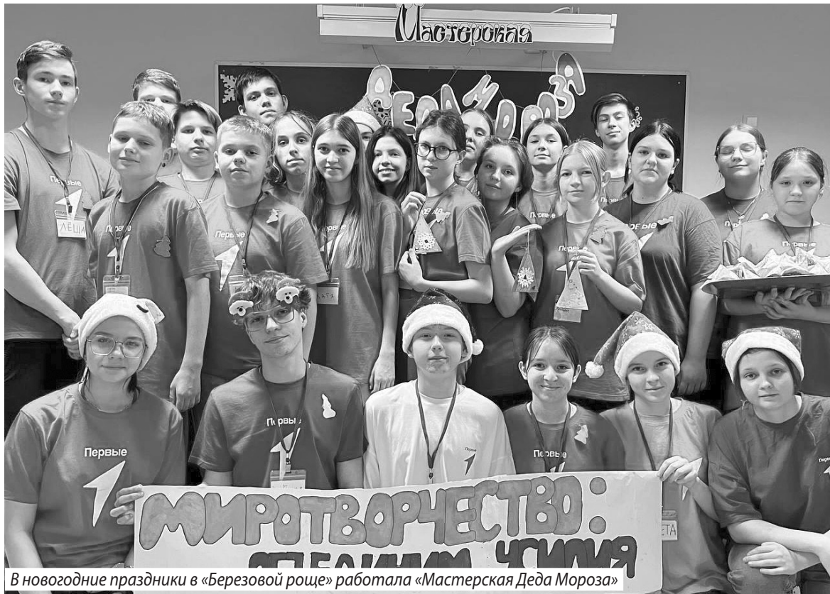
В новогодние праздники в «Березовой роще» работала «Мастерская Деда Мороза»

Традиционно в один из дней профильной смены в «Березовую рощу» приехали почетные гости.