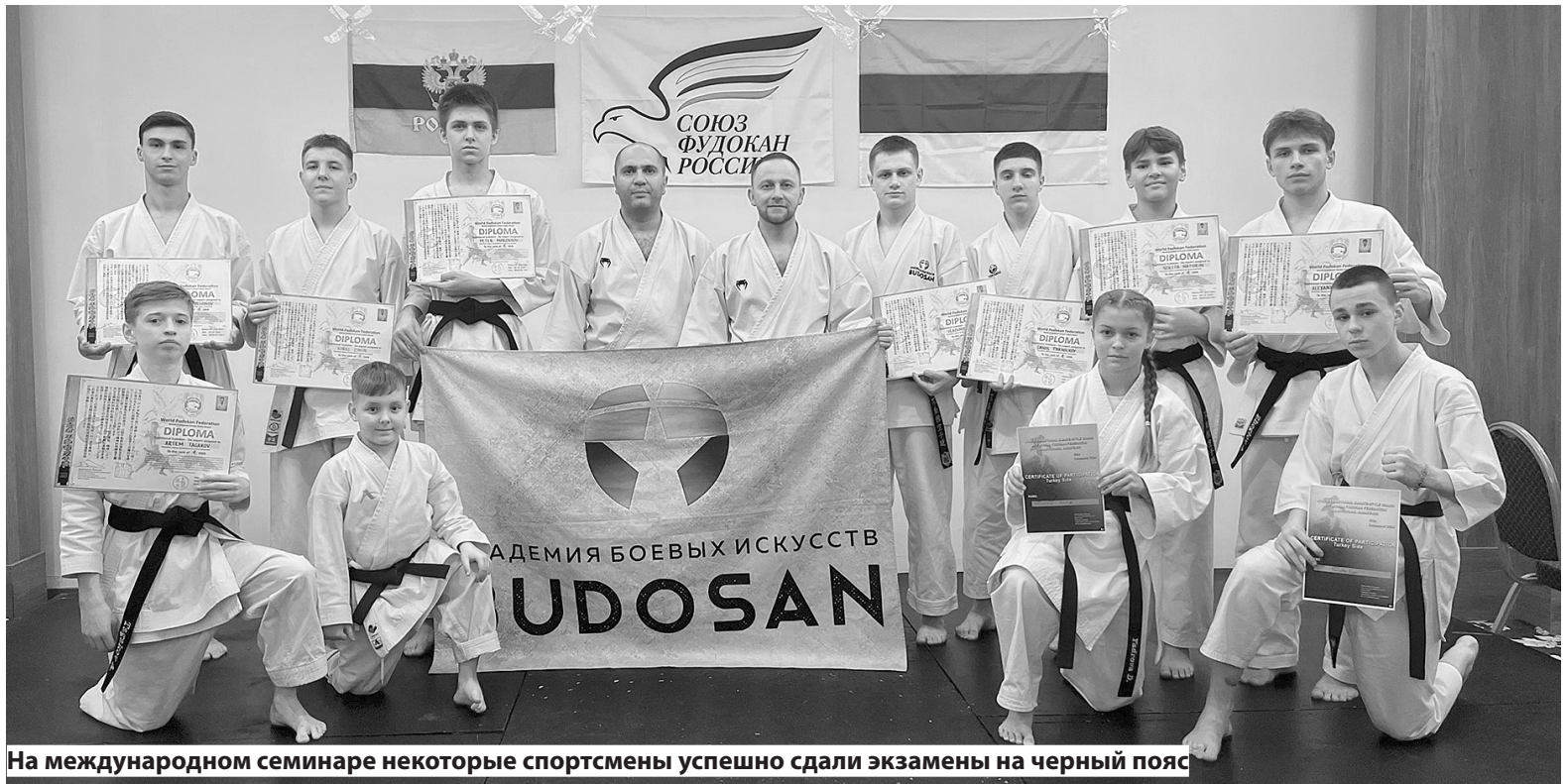
На международном семинаре некоторые спортсмены успешно сдали экзамены на черный пояс