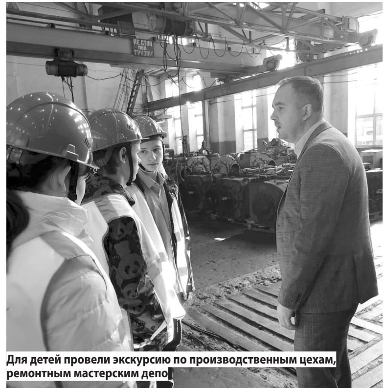
Для детей провели экскурсию по производственным цехам, ремонтным мастерским депо