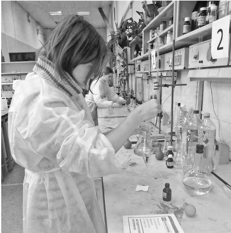
Ребята из Новоталицкой средней школы посетили лаборатории химуниверситета, где провели ряд экспериментов

- Профессиональная подготовка для молодежи особенно важна. Подобные экскурсии дают возможность познакомиться с ведущими ивановскими предприятиями и организациями, а в дальнейшем определиться с вы-