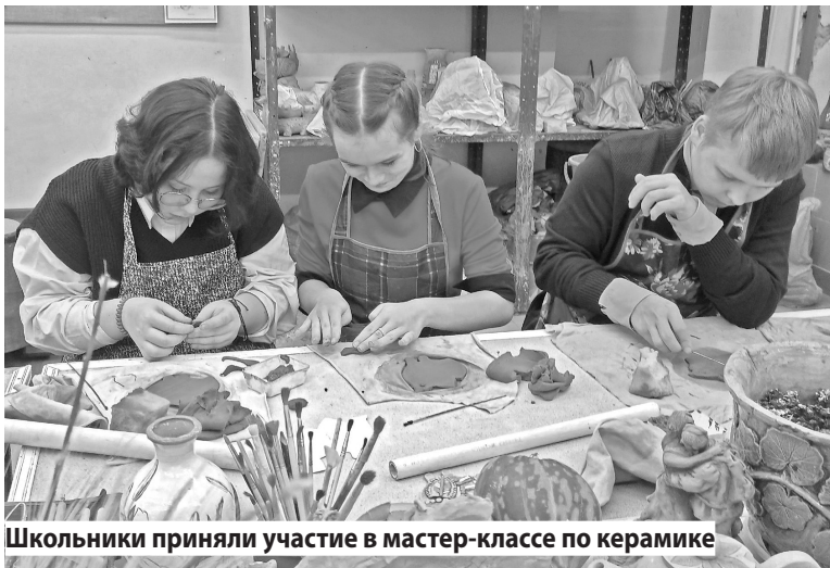
Школьники приняли участие в мастер-классе по керамике