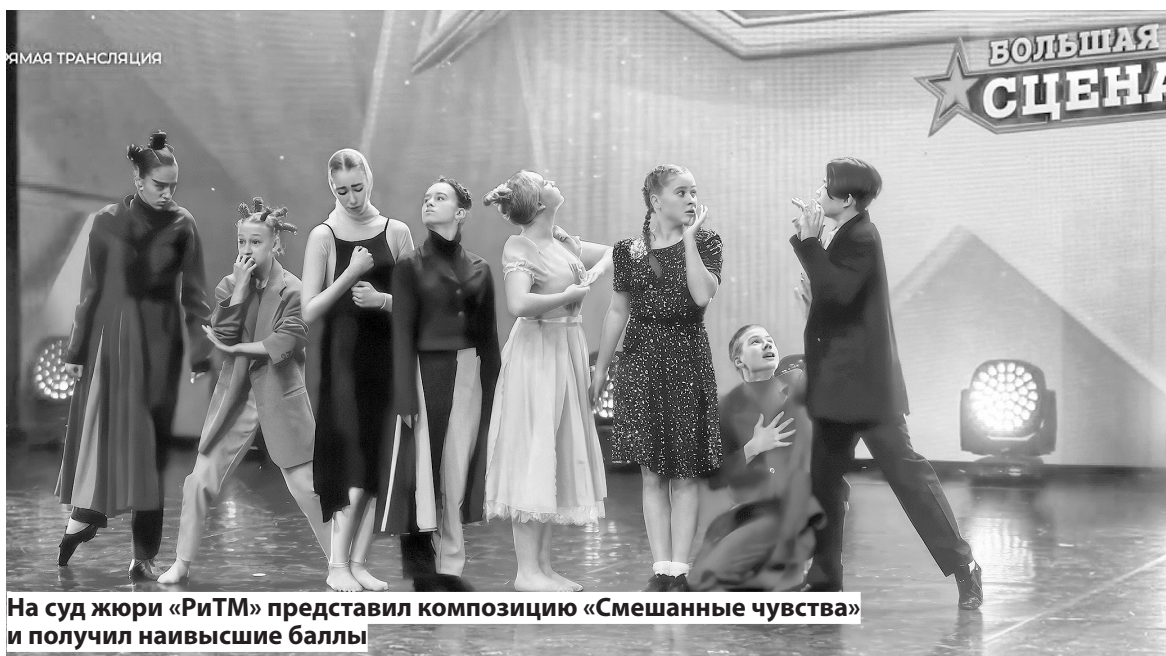
На суд жюри «РиТМ» представил композицию «Смешанные чувства» и получил наивысшие баллы

Победы завоевали и другие коллективы Ивановского района. Так, 3 ноября состоялась торжественная церемония награждения участников всероссийского фестиваля