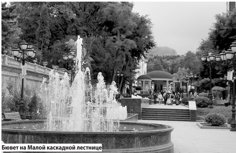
Бювет на Малой каскадной лестнице