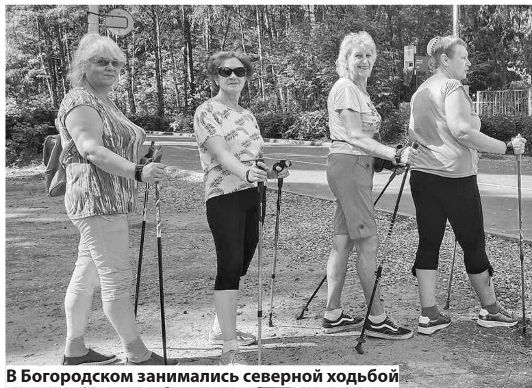
В Богородском занимались северной ходьбой

Алена КОРОЛЕВА