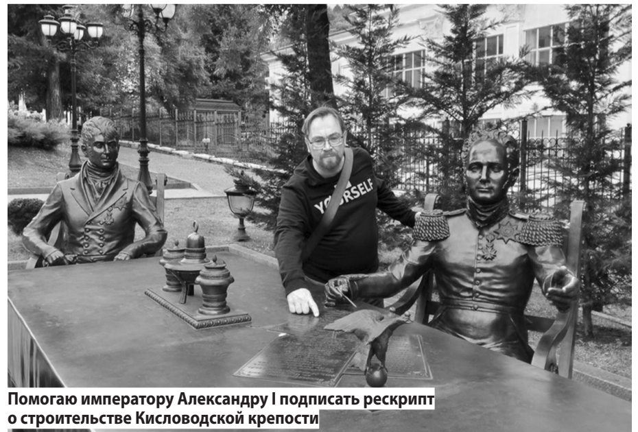
Помогаю императору Александру I подписать рескрипт о строительстве Кисловодской крепости