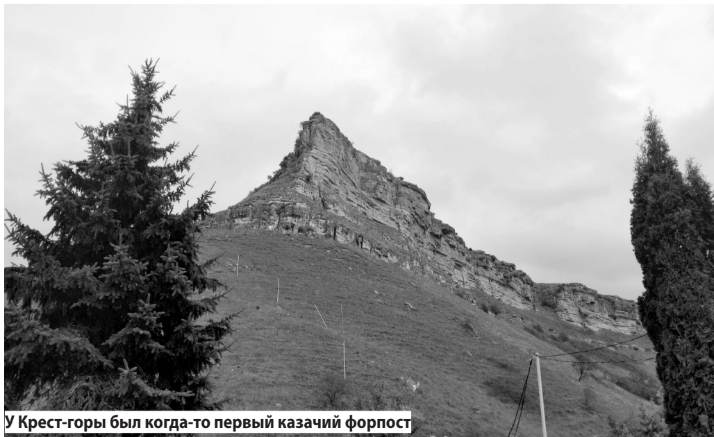
У Крест-горы был когда-то первый казачий форпост