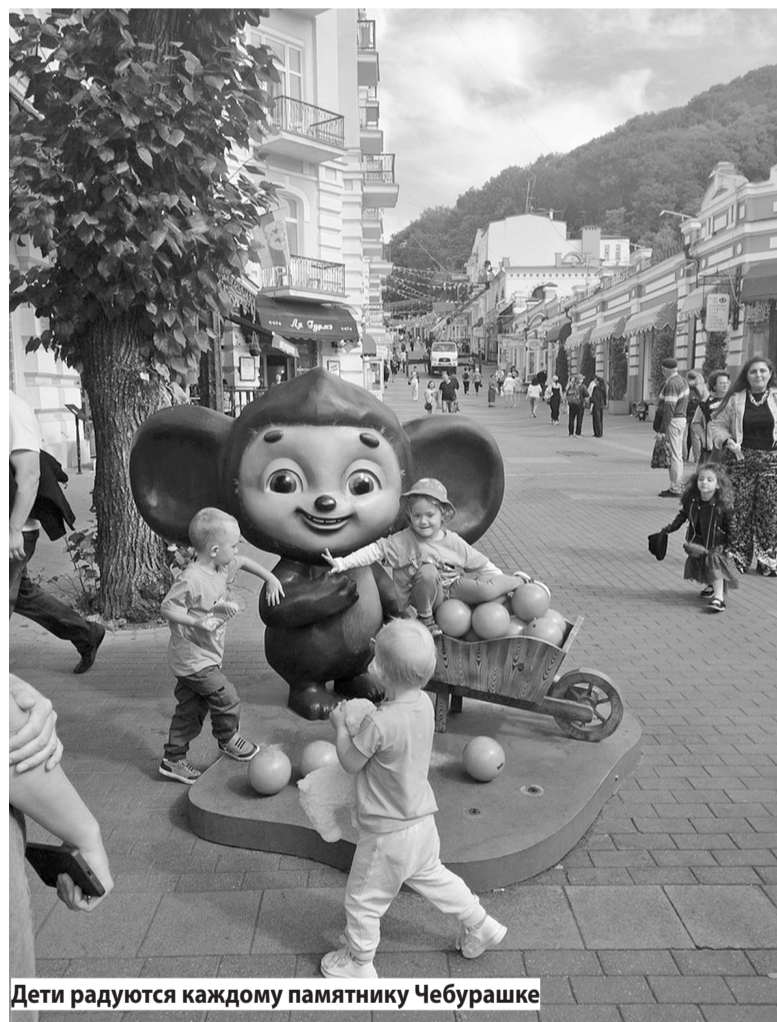
Дети радуются каждому памятнику Чебурашке