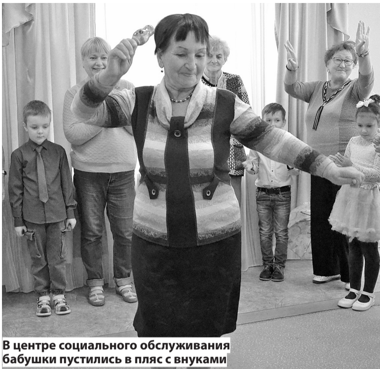
В центре социального обслуживания бабушки пустились в пляс с внуками

Творческим подарком стали выступления коллективов Ивановского районного дома культуры – народного хора русской песни «Сударушки», хореографической студии «Притяжение», вокальной студии «Соцветие голосов», Анастасии Тарасовой, Софии Стребковой и Дарины Гребновой.