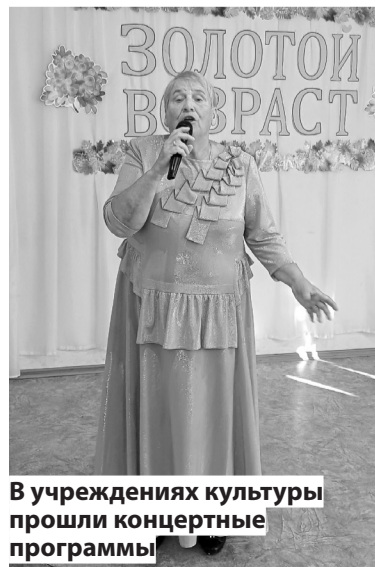
В учреждениях культуры прошли концертные программы