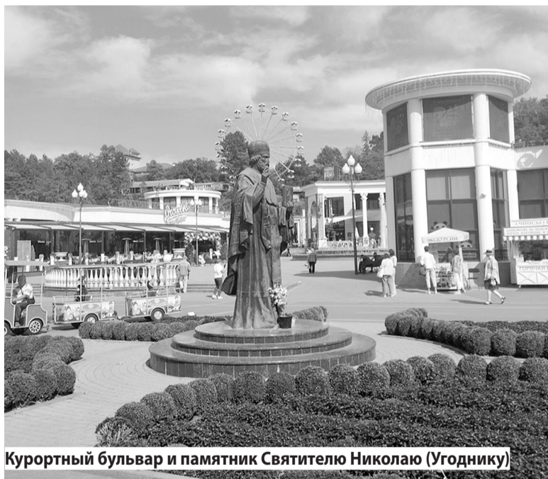
Курортный бульвар и памятник Святителю Николаю (Угоднику)

Мы с супругой каждое утро ходили к новому бювету, расположенному на Малой каскадной лестнице. Правда, «Нарзан» мне не очень понравился, я предпочитал более газированные и вкусные «Ессентуки №4». Набирали воды в дорогу и решали, куда отправимся в этот день. В первый день взяли обзорную экскурсию по городу. В Кисловодске есть что посмотреть - и красивые храмы, и множество