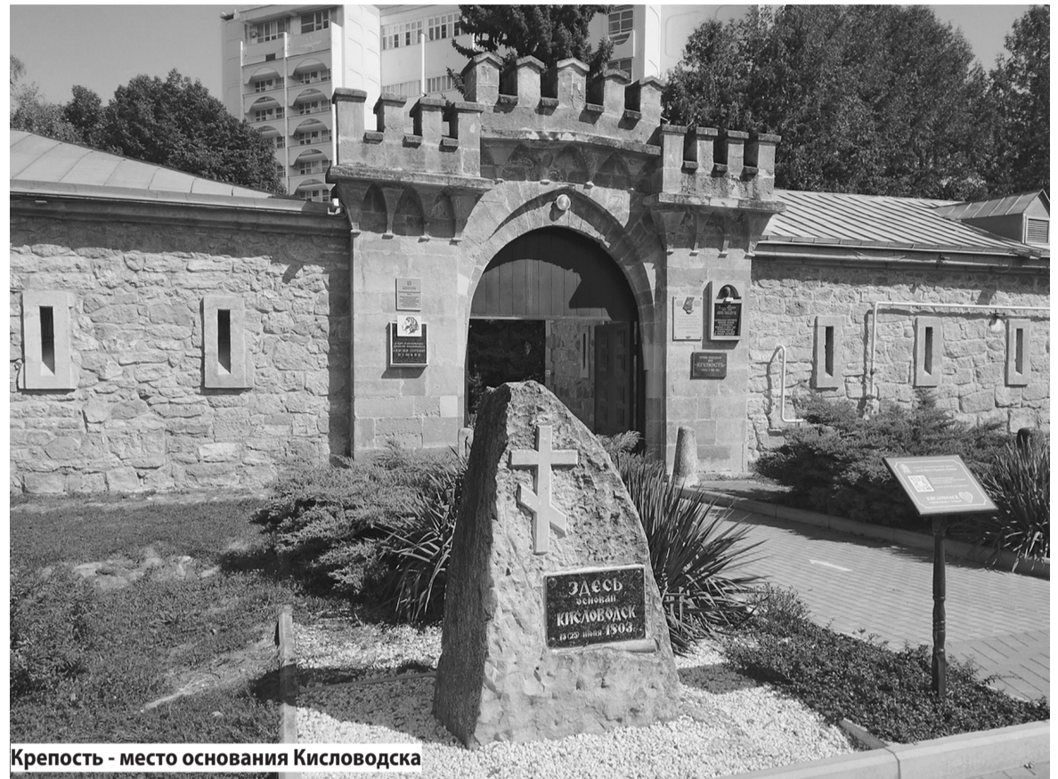
Крепость - место основания Кисловодска

Кисловодск - самый южный из городов КМВ. Он располагается между тремя горными хребтами - Боргустанским, Джинальским и Кабардинским - на высоте от 815 до 1062 метров. Южный выезд из города - это уже Карачаево-Черкесия. И климат здесь отличается от пятигорского. Главной достопримечательностью этих предгорий стал «Нарзан», поэтому на каждом шагу можно встретить нарзанные галереи, бюветы и ванны. Медики давно признали Кисловодск кардиологическим курортом. Людям с сердечно-сосудистыми заболе-