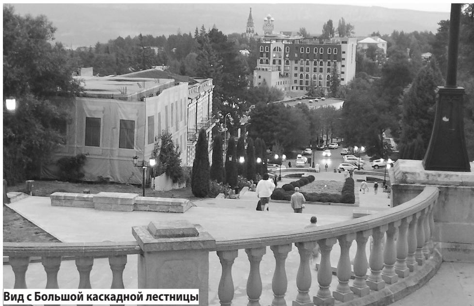
Вид с Большой каскадной лестницы