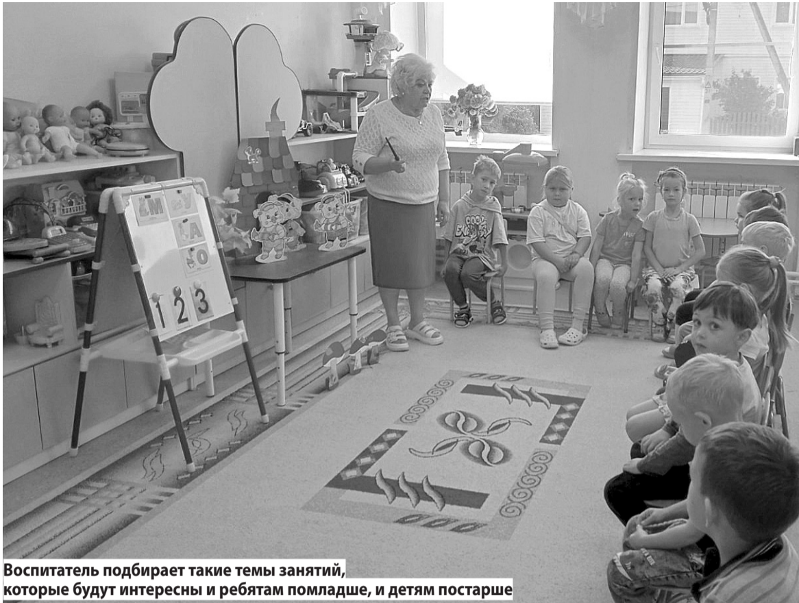
Воспитатель подбирает такие темы занятий, которые будут интересны и ребятам помладше, и детям постарше