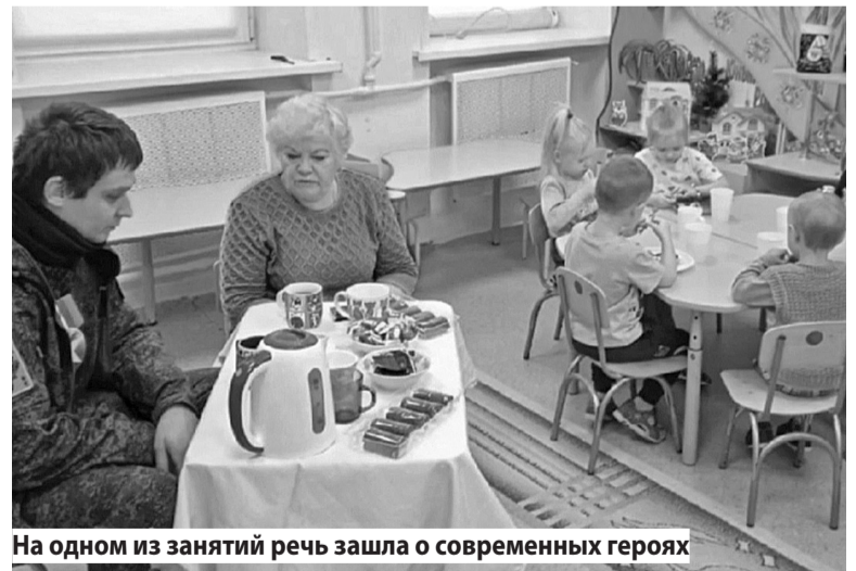
На одном из занятий речь зашла о современных героях

В настоящее время воспитатель продолжает обучать ребят в детском саду чтению, грамоте и счету. Она отмечает, что к занятиям основательно готовится и всегда использует наглядные материалы. «Чтобы ребенок не только на слух воспринимал новую тему, но и что-то посмотрел, потрогал. Также стараюсь сочетать теорию с практической деятельностью, чтобы дети по-