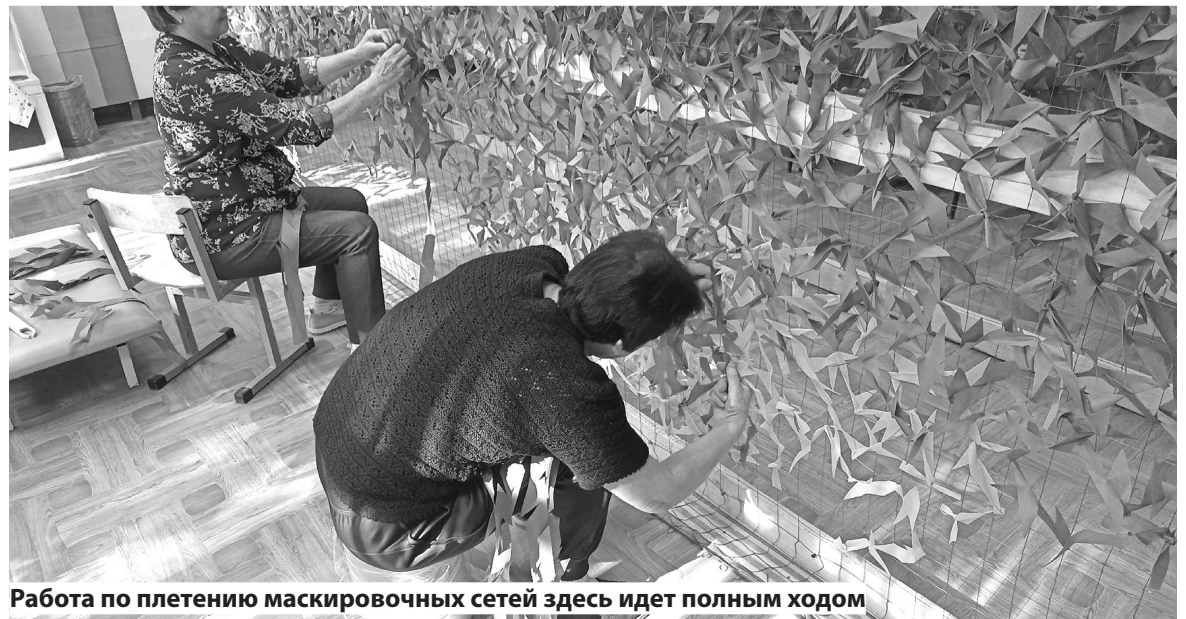
Работа по плетению маскировочных сетей здесь идет полным ходом