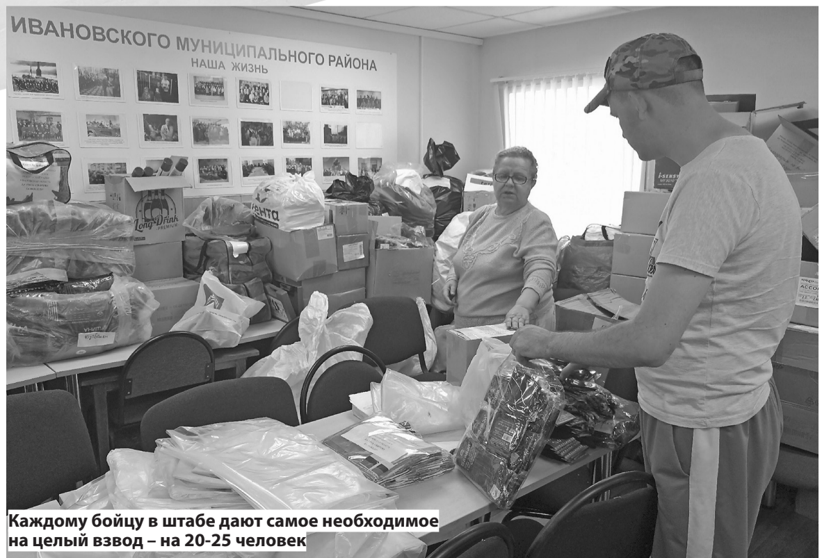
Каждому бойцу в штабе дают самое необходимое на целый взвод - на 20-25 человек