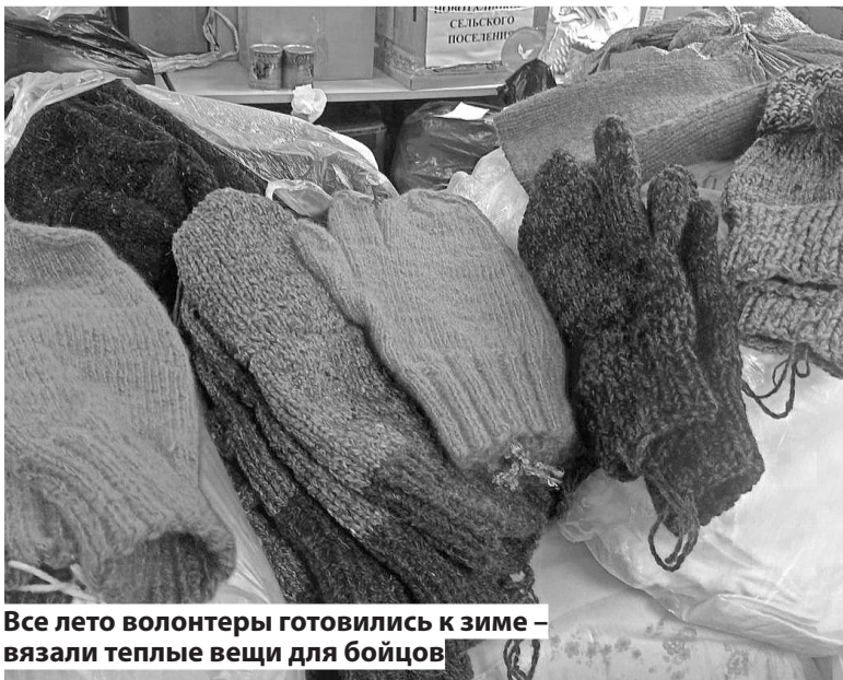
Все лето волонтеры готовились к зиме - вязали теплые вещи для бойцов