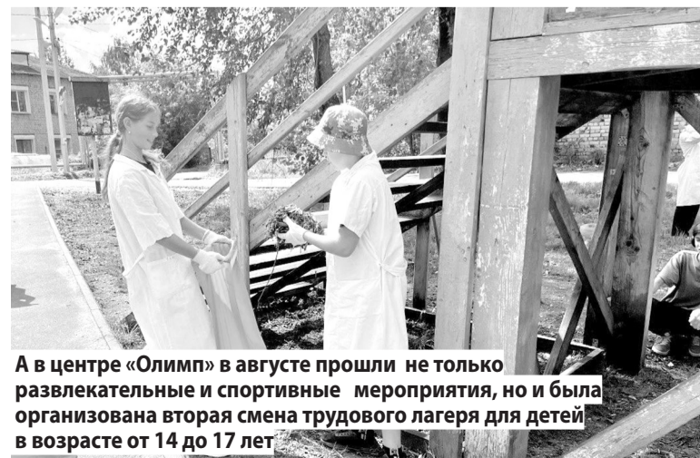
А в центре «Олимп» в августе прошли не только развлекательные и спортивные мероприятия, но и была организована вторая смена трудового лагеря для детей в возрасте от 14 до 17 лет

Также ребята из школьного лагеря посетили мастер-класс, который провела заведующая Богородским сельским домом культуры