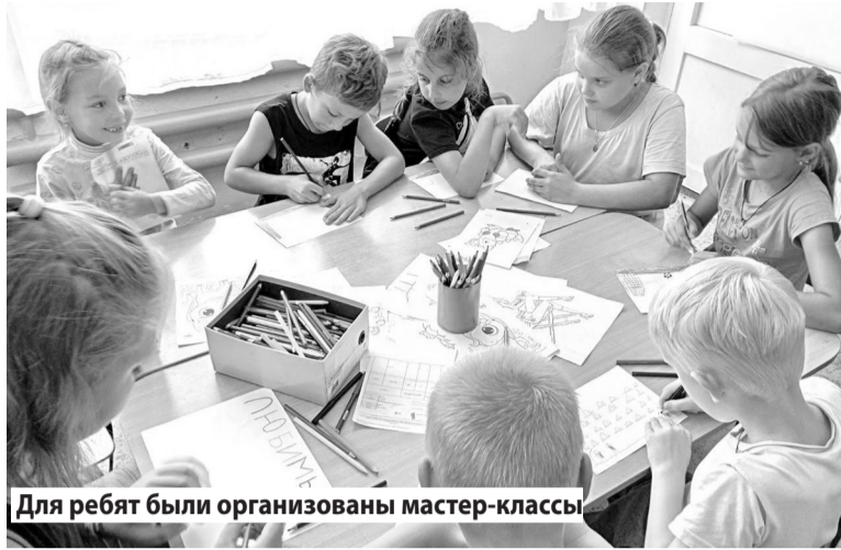
Для ребят были организованы мастер-классы

В Чернореченской сельской библиотеке отметили День рождения русской тельняшки. Посетители узнали об истории возникновения, легендах, видах тельняшек в нашей стране и о том, почему она стала