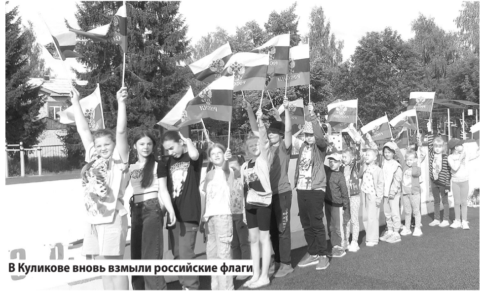
В Куликове вновь взмыли российские флаги