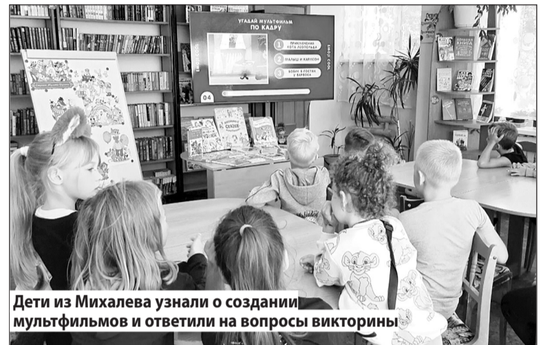
Дети из Михалева узнали о создании мультфильмов и ответили на вопросы викторины

Мероприятия для детей состоялись и в других учреждениях. В детских садах, например, отметили День рождения Чебурашки. В Богданихе ребята с радостью погрузились в мир сказки: слушали увлекательные истории о приключениях этого героя и его верного друга Крокодила Гены. Дети подготовили подарки для именинника, спели «Пусть бегут неуклюже».