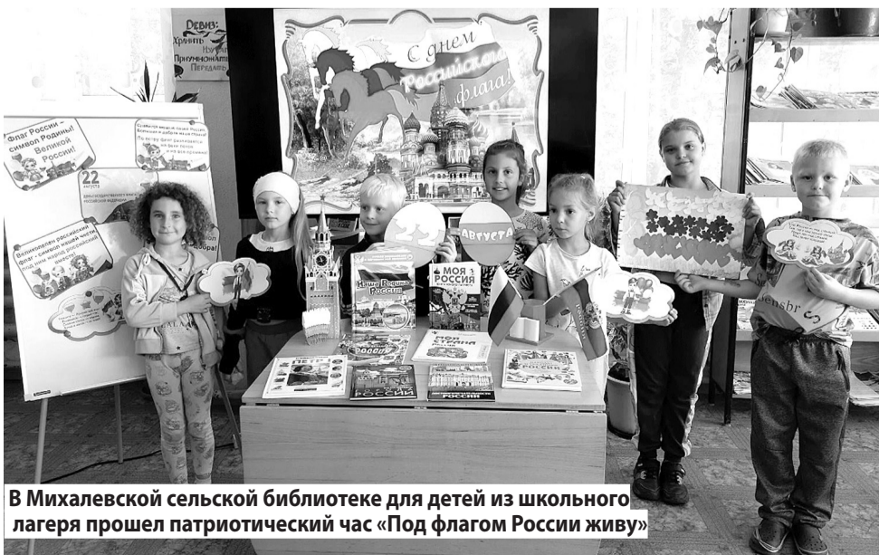
В Михалевской сельской библиотеке для детей из школьного лагеря прошел патриотический час «Под флагом России живу»

Подготовила Алена КОРОЛЕВА