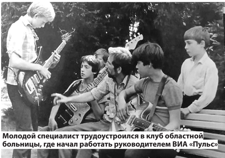
Молодой специалист трудоустроился в клуб областной больницы, где начал работать руководителем ВИА «Пульс»