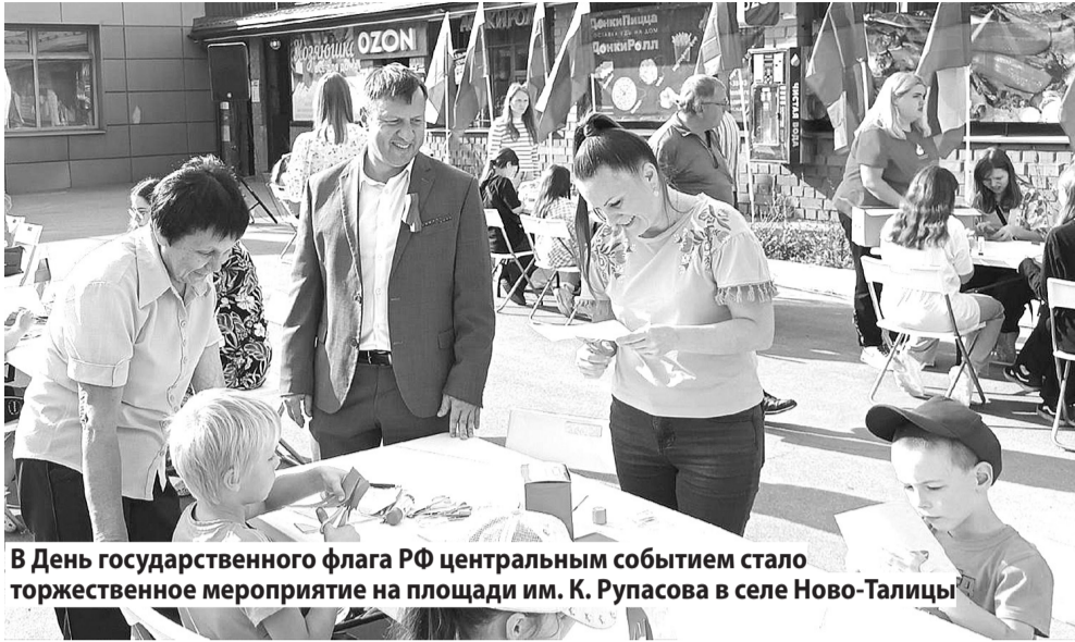
В День государственного флага РФ центральным событием стало торжественное мероприятие на площади им. К. Рупасова в селе Ново-Талицы