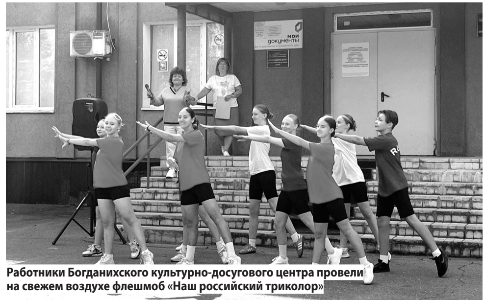
Работники Богданихского культурно-досугового центра провели на свежем воздухе флешмоб «Наш российский триколор»