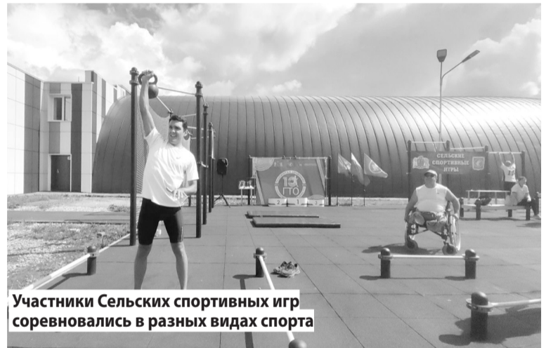
Участники Сельских спортивных игр соревновались в разных видах спорта

Ребята, которые отдыхают в детских загородных и санаторно-оздоровительных лагерях, тоже с пользой провели время. На базе ДОЛ «Огонек» сотрудники МО МВД