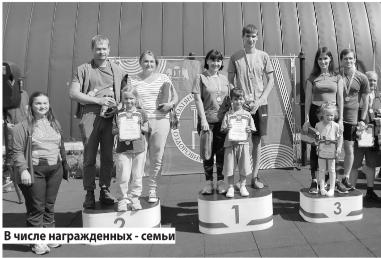
В числе награжденных - семь

Торжественное мероприятие, посвященное Всероссийскому Дню физкультурника, состоялось в селе Ново-Талицы на базе Молодежно-спортивного центра «Олимп». Спортсмены из Ивановского района приняли участие в летнем фестивале ВФСК ГТО и сельских спортивных играх, где соревновались в таких направлениях, как гиревой спорт, армспорт, силовое троеборье, легкая атлетика, вышибаловка, перетягивание каната, троеборье ВФСК ГТО (поднимание туловища, сгибание и раз-