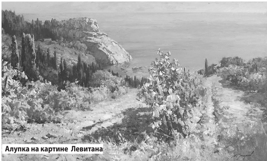
Алупка на картине Левитана

сказывают туристам, что «это полотно художник написал после путешествия по Волге в 1845 году, и через несколько недель картину приобрел Михаил Воронцов, впечатленный такими великолепными пейзажами».