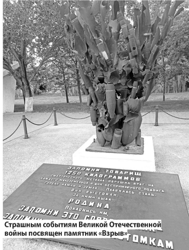
Страшным событиям Великой Отечественной войны посвящен памятник «Взрыв»

Страшным событиям Великой Отечественной войны посвящен памятник «Взрыв». Именно он напоминает нам о том, каким