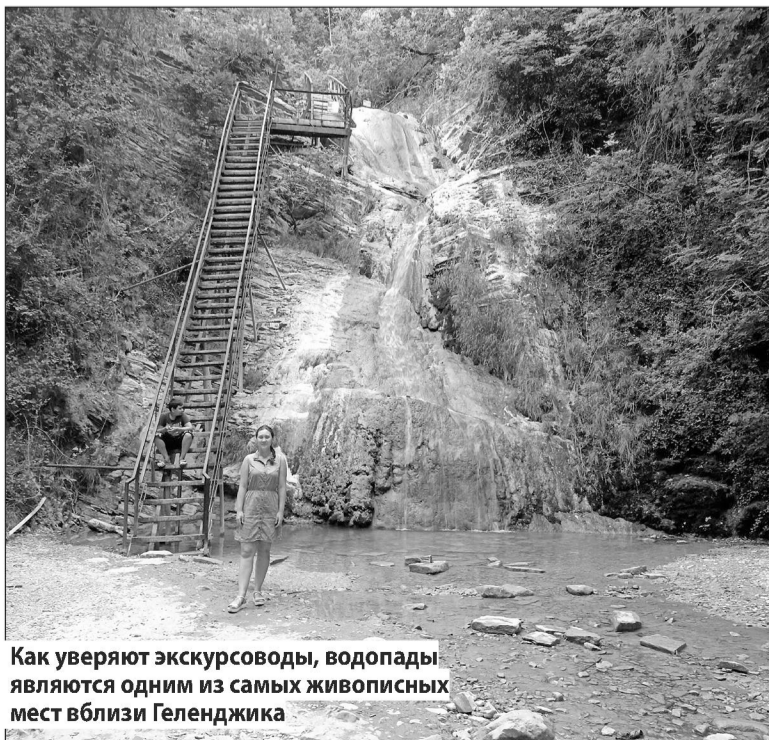
Как уверяют экскурсоводы, водопады являются одним из самых живописных мест вблизи Геленджика