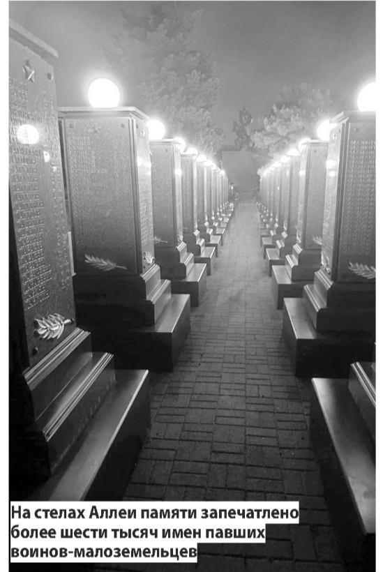
На стелах Аллеи памяти запечатлено более шести тысяч имен павших воинов-малоземельцев

Мыс Мысхако тоже считается одним из красивейших мест села. Он представляет собой небольшую песчаную возвышенность с кустарниковой порослью. С вершины мыса открывается панорама Черного моря, а у подножия