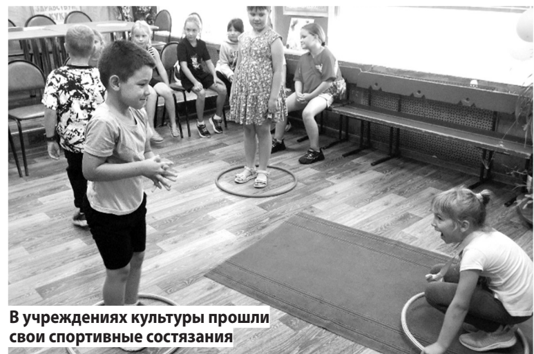
В учреждениях культуры прошли свои спортивные состязания