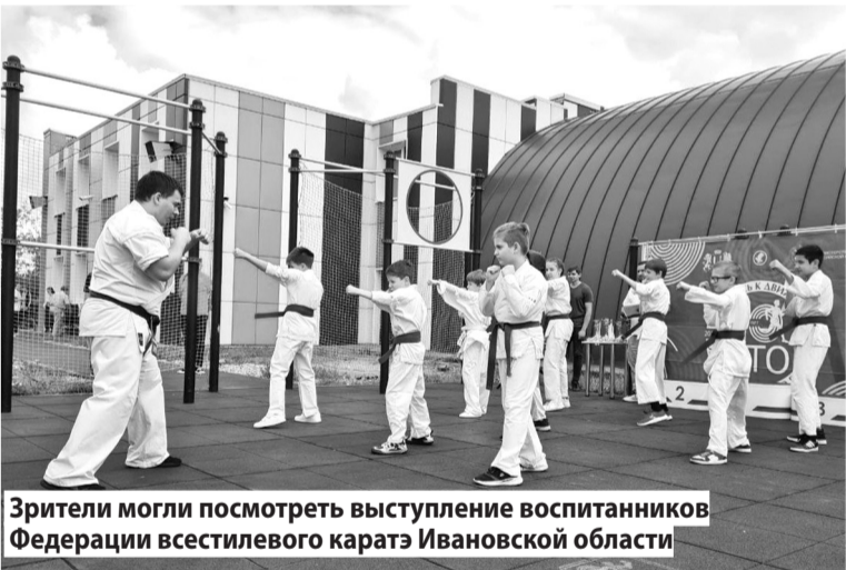
Зрители могли посмотреть выступление воспитанников Федерации восточного каратэ Ивановской области