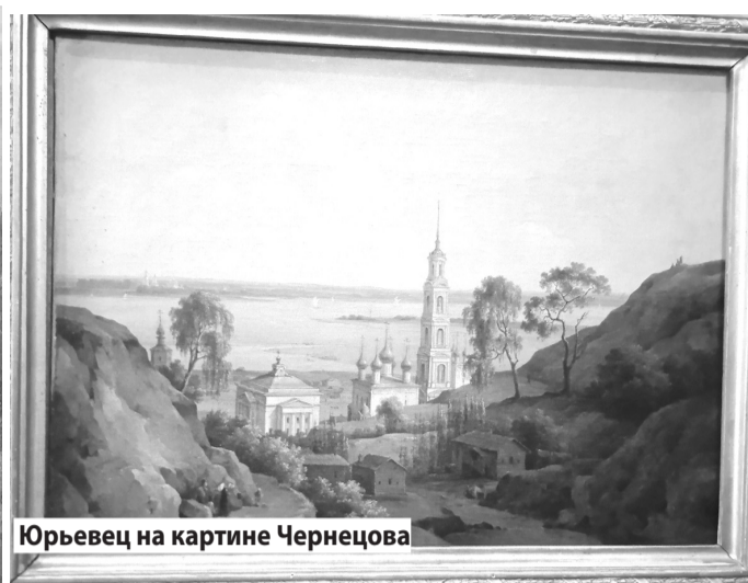
Юрьевец на картине Чернецова

Основное украшение Воронцовского дворца — мотив полугой стрельчатой арки — неодно-