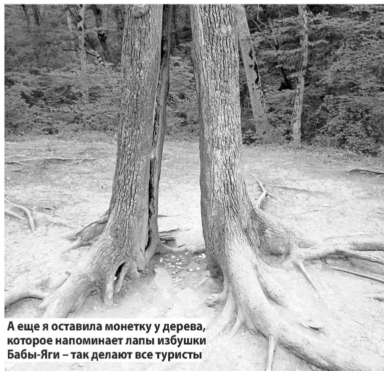
А еще я оставила монетку у дерева, которое напоминает лапы избушки Бабы-Яги – так делают все туристы