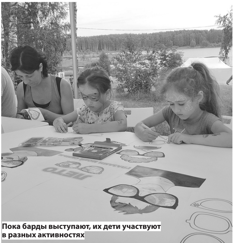
Пока барды выступают, их дети участвуют в разных активностях