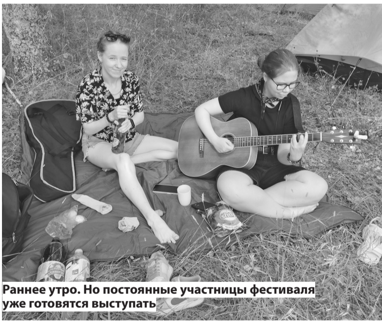
Раннее утро. Но постоянные участницы фестиваля уже готовятся выступить

Программа фестиваля была очень насыщенной. Пока на главной сцене выступали барды, участники групп поддержки и гости смогли стать участниками разнообразных детских, спортивных и туристических локаций. Дамы особенно старались победить в традиционном конкурсе на луч-