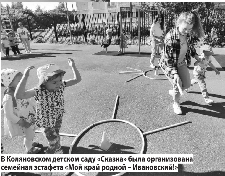
В Колянновском детском саду «Сказка» была организована семейная эстафета «Мой край родной - Ивановский!»

В других сельских библиотеках для детей были проведены краеведческие часы. Например, в Железнодорожной юные читатели раскрыли понятие «малая родина». Они делились мыслями о том, в чем должна проявляться ответственность перед ней, что значит думать и переживать за судьбу любимого края. Дети вспомнили