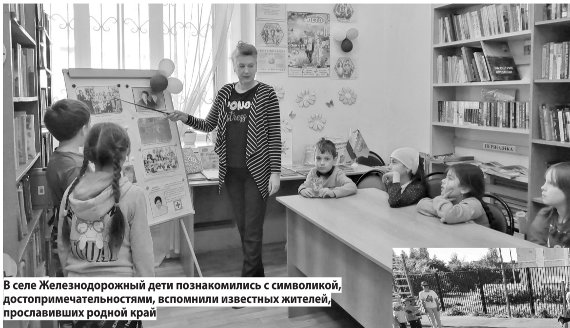
В селе Железнодорожный дети познакомились с символикой, достопримечательностями, вспомнили известных жителей, прославивших родной край

А в Куликовской сельской библиотеке в преддверии 95-летия Ивановского района был проведен краеведческий час «Край родной, навек любимый». Началось мероприятие с конкурса рисунков на асфальте. Дети проявили фантазию и изобразили свою малую Ро-