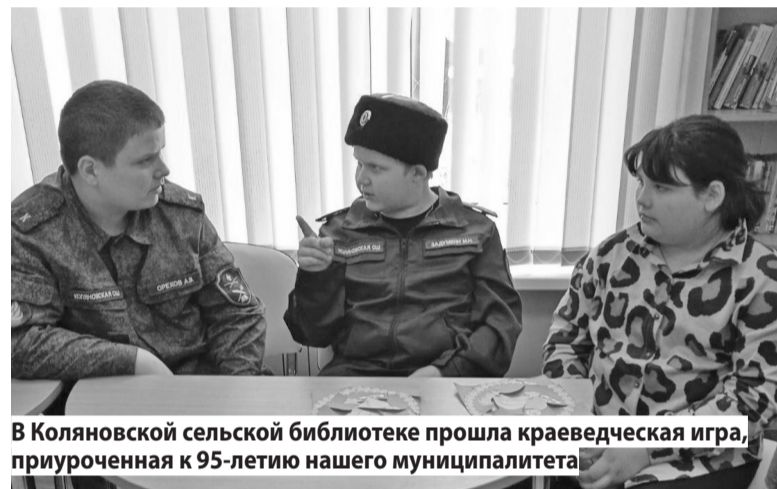
В Колянновской сельской библиотеке прошла краеведческая игра, приуроченная к 95-летию нашего муниципалитета

летописи Ивановского района - это судьбы нескольких поколений его жителей. Некоторые имена наших земляков назвали в детской библиотеке «Золотой ключик».