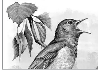
ДЛЯ ЧЕГО СЧИТАТЬ СОЛОВЬЕВ