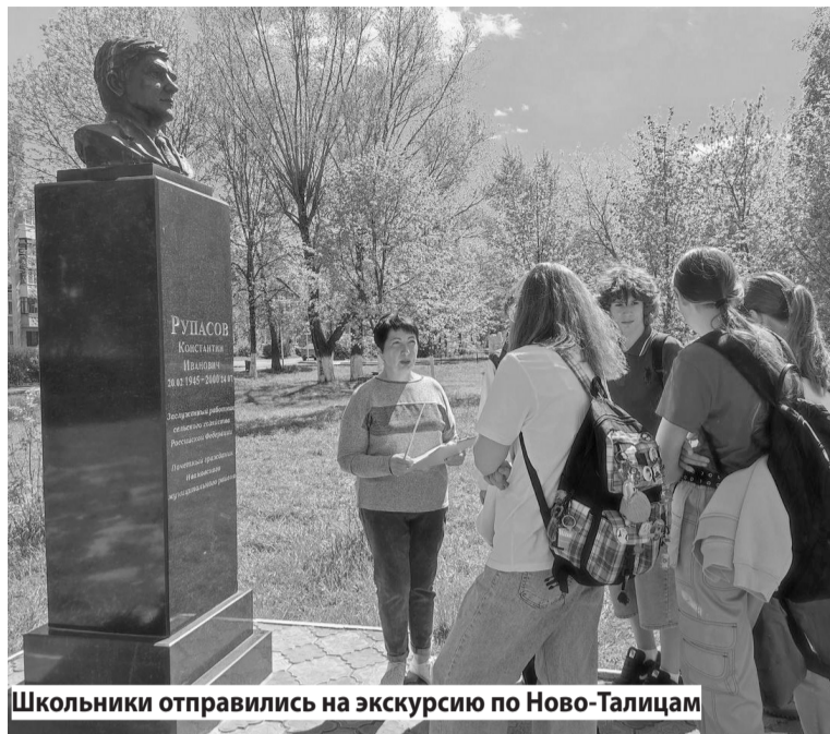
Школьники отправились на экскурсию по Ново-Талицам