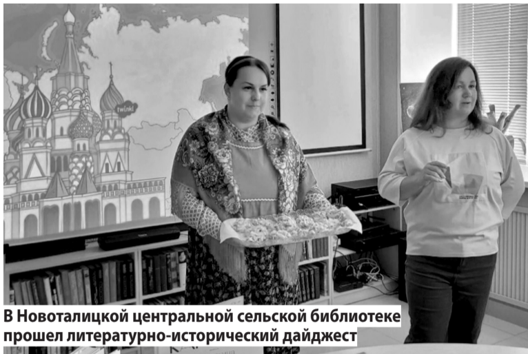
В Новоталицкой центральной сельской библиотеке прошел литературно-исторический дайджест

Мероприятия ко Дню России прошли также в учреждениях культуры. Так, например, в Иванцевском сельском доме культуры ребята мастерили бумажных голубков в цветах российского триколора. В Дегтяревском сельском клубе дети