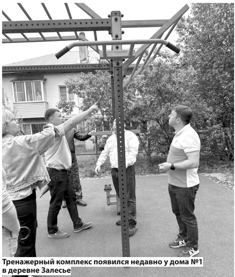
Тренажерный комплекс появился недавно у дома №1 в деревне Залесье