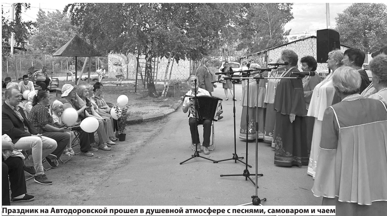
Праздник на Автодорожской прошел в душевной атмосфере с песнями, самоваром и чаем

Идею обустройства пешеходной дорожки предложила предсе-