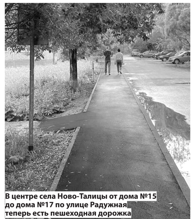
В центре села Новоталицы от дома №15 до дома №17 по улице Радужная теперь есть пешеходная дорожка