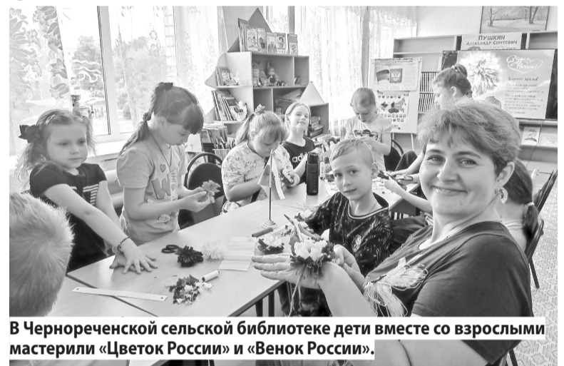
В Чернореченской сельской библиотеке дети вместе со взрослыми мастерили «Цветок России» и «Венок России».

Завершилась встреча мастер-классом по изготовлению поздравительной фокус-открытки от методиста Новоталицкой центральной библиотеки. На ней был