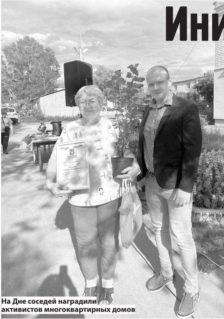
На Дне соседей наградили активистов многоквартирных домов

Новоталицкое сельское поселение не первый раз участвует в региональной программе «Поддержка местных инициатив», которая реализуется по инициативе губернатора Станислава Воскресенского. В этом году областное финансирование получили сразу пять проектов жителей Новоталиц и Залесья, заявленных на конкурс.