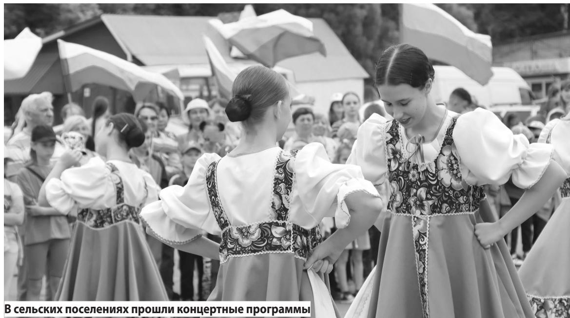
В сельских поселениях прошли концертные программы

Алена КОРОЛЕВА