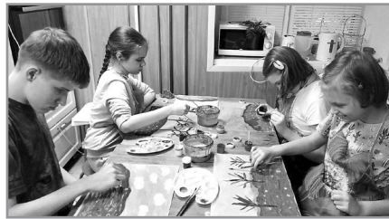
«ГРАНИ»: ОТ СЕРДЦА К СЕРДЦУ