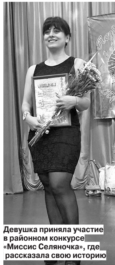
Девушка приняла участие в районном конкурсе «Миссис Селяночка», где рассказала свою историю

Самое главное правило при похудении - есть нужно обязательно, говорит девушка. Когда организм голодает, он испытывает стресс. А значит, в любой момент можно съесть лишнего и набрать еще несколько килограммов. Помимо этого, голодание приводит к замедлению обмена веществ. В итоге нарушается работа внутренних органов, активно выделяется гормон кортизол, который тормозит все процессы в организме, в том числе и процесс сжигания жира.