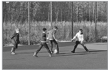
НОВАЯ СПОРТИВНАЯ ПЛОЩАДКА ОТКРЫТА В ДЕРЕВНЕ ЖУКОВО