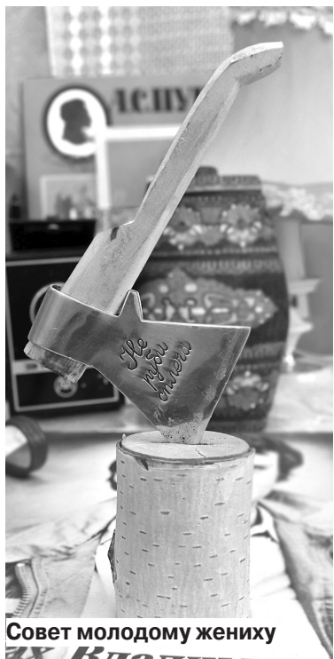
Совет молодому жениху