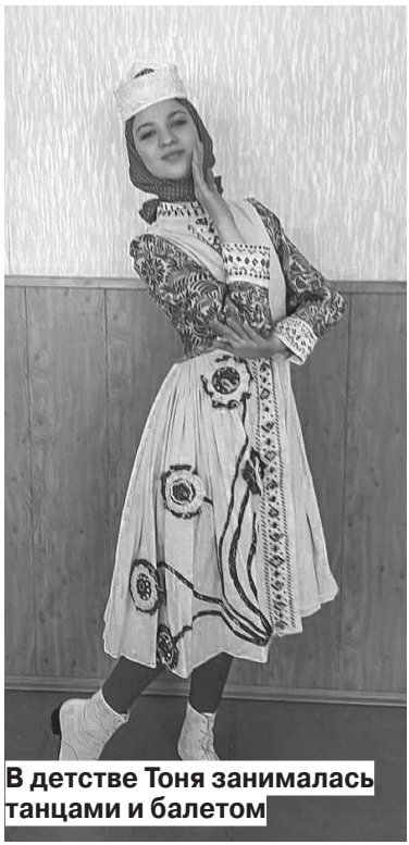
В детстве Тоня занималась танцами и балетом

Мне всегда было интересно осваивать новые направления. В первом декретном отпуске я училась на бухгалтера. А во втором поняла, что хочу работать с детьми. Меня заинтересовала логопедия, и я получила высшее образование по этому направлению. В итоге я открыла несколько логопедических кабинетов как в городе, так и по области. А позже начала и сама заниматься с детьми. Семь лет назад