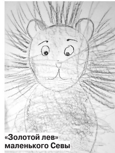
«Золотой лев» маленького Севы