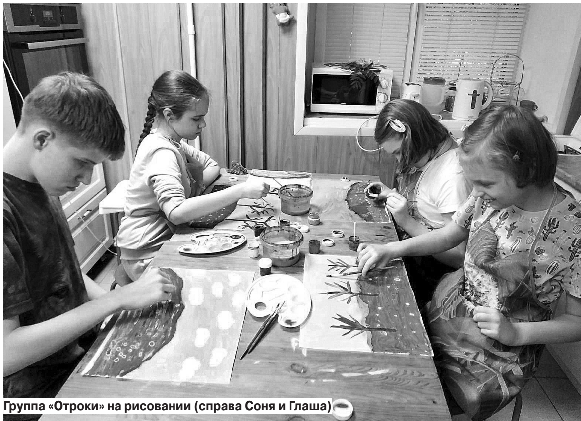
Группа «Отроки» на рисовании (справа Соня и Глаша)

В «Гранях» молодые инвалиды учатся кулинарии, уборке помещений, уходу за одеждой и обувью и другим социально-бытовым и